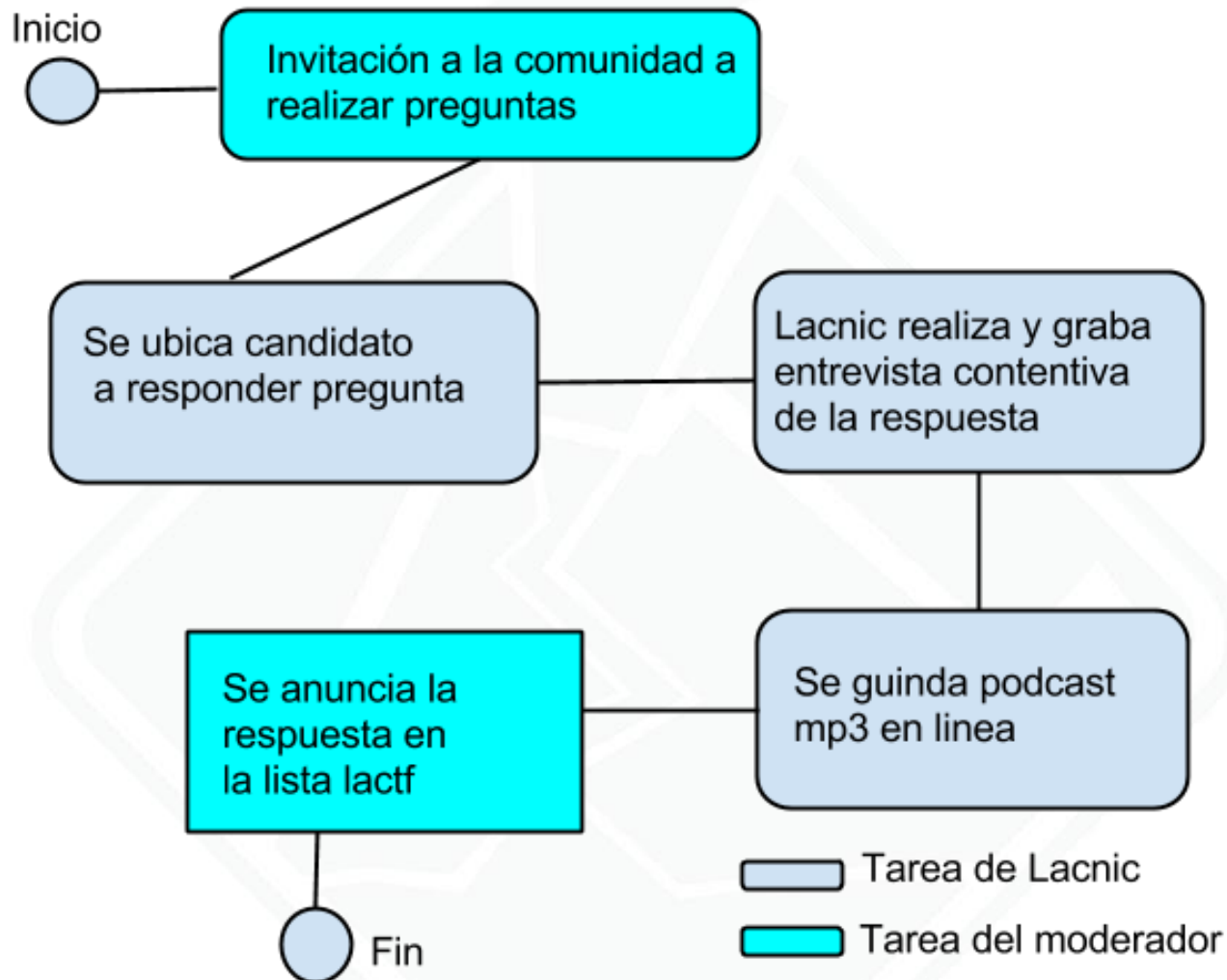
Diagrama de flujo